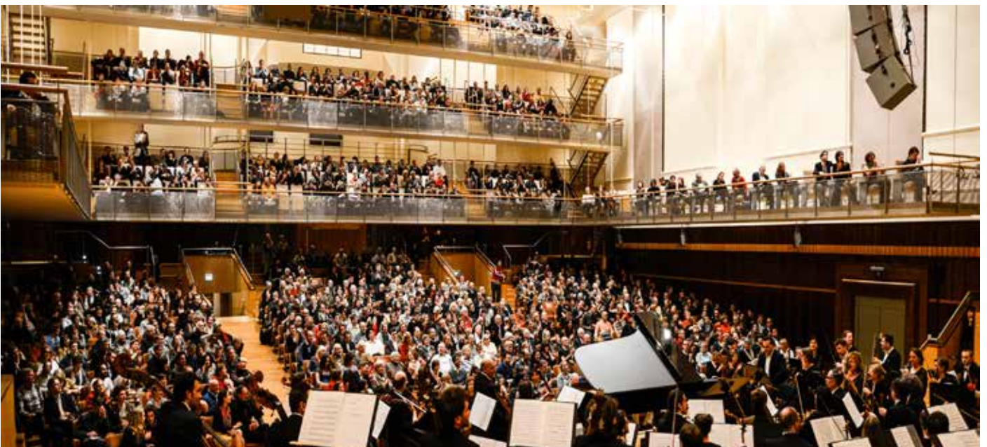
Studio 4 | Flagey | Bruxelles